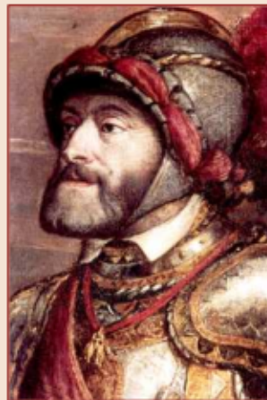
Carles I / V

L'Imperi Hispànic va ser un dels primers imperis globals —un imperi que abastava possessions a tots els continents — a diferència dels imperis de l' Antiguitat i medievals . Altres imperis globals posteriors o contemporanis foren l' Imperi portuguès i l' Imperi britànic .