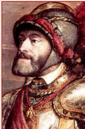
Carles I / V

L'Imperi Hispànic va ser un dels primers imperis globals —un imperi que abastava possessions a tots els continents — a diferència dels imperis de l' Antiguitat i medievals . Altres imperis globals posteriors o contemporanis foren l' Imperi portuguès i l' Imperi britànic .