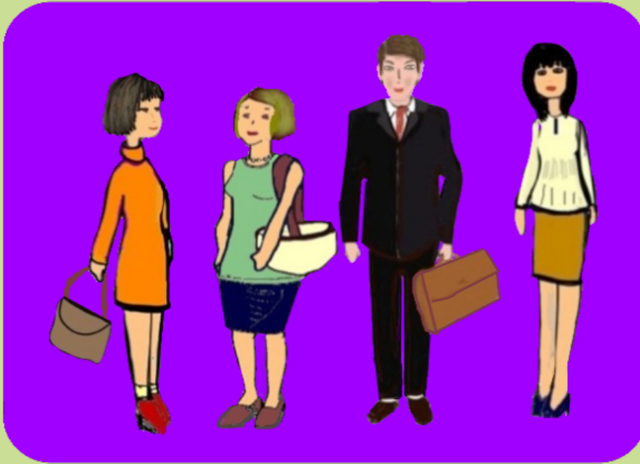
POBLACIÓ QUE TREBALLA